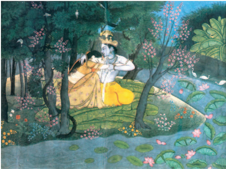
36. «Ο Θεός Κρίσνα και το σύμβολο σε ένα δάσος», 1780 μ.Χ. Με τη ζωγραφική, σε τοιχογραφίες ή σε χαρτί, απεικονίζονται οι περιπέτειες των θεών ή η ζωή της αυλής, με καθαρές γραμμές και έντονα χρώματα.

Πού διακρίνετε γεωμετρικά στερεά στις εικόνες 36,37;