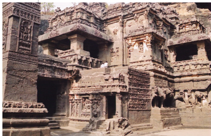
31. Ο ναός της Ελόρα καταλαμβάνει ένα χώρο δυο φορές σαν το χώρο της Ακρόπολης των Αθηνών.

Στην περιοχή Μαχαράστρα διασώζονται οι ναοί της Ελόρα και της Ατζάντα, οι οποίοι είναι λαξευμένοι σε βράχους, με πολλές σπηλιές και κατασκευασμένους χώρους από πέτρα. Εξωτερικά και εσωτερικά κοσμούνται από πλήθος γλυπτών και ζωγραφικών παραστάσεων.