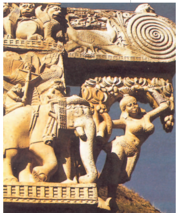
37. Γλυπτική διακόσμηση από την ανατολική πύλη της Μεγάλης Στούπας του Σανχί.