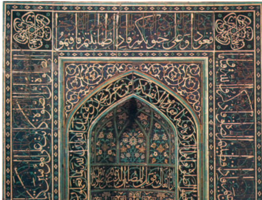
25. Κόγχη με πλακάκια διακοσμημένα καλλιγραφικά, 16ος μ.Χ. αι., Ιράν.