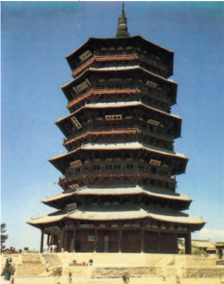
38. Παγόδα στο Γινγκσιέν, 1058 μ.Χ.

Χαρακτηριστικό κτίριο είναι η παγόδα , είδος ναού που στεγάζει ιερά λείψανα και έχει συμβολική σημασία. Τετράγωνη ή πολυγωνική, η παγόδα είναι πολυώροφη, φτιαγμένη από ξύλο και κεραμίδι.