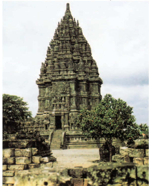
35. Ναός του Σίβα στο Πραμπανάν της Ιάβα, 9ος μ.Χ. αι.

Πού διακρίνετε γεωμετρικά στερεά στις εικόνες 36,37;