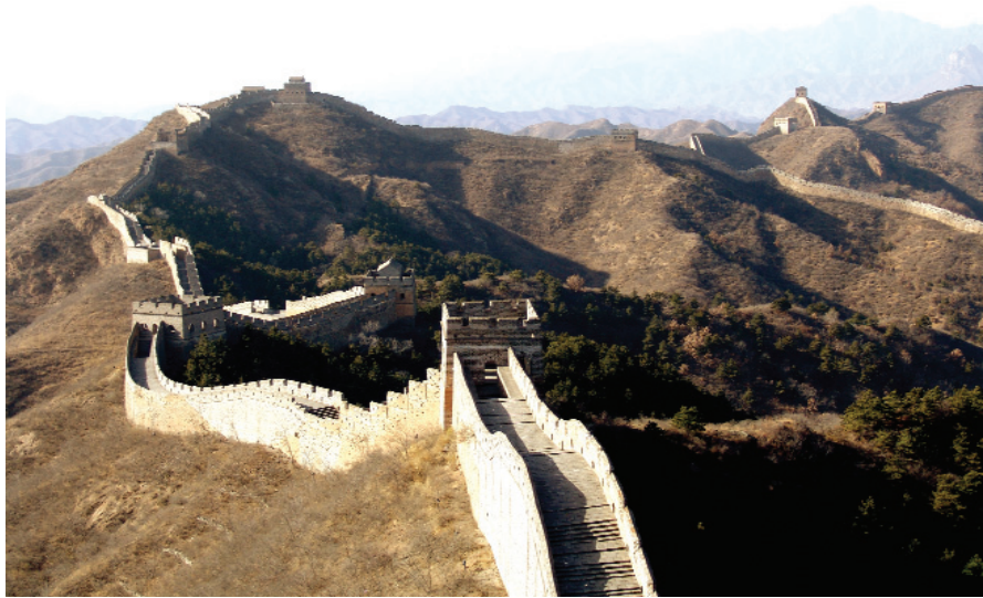
39. Τον 3ο αι. π.Χ., κατά τη δυναστεία Τσιν, κατασκευάζεται το μεγάλο Σινικό Τείχος, το οποίο ξεδιπλώνεται στο βόρειο μέρος της Κίνας, σε έκταση 4.800 χιλιομέτρων.