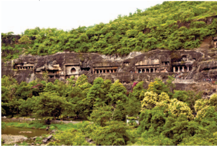
30. Ο ναός της Ατζάντα στη Μαχαράστρα, 1ος-7ος μ.Χ. αι.

29. Κεφάλι του Βούδα, 4ος-5ος μ.Χ. αι. Ο Βούδας αποδίδεται με χαρακτηριστικά, τα οποία πιστεύουν ότι έχει: ο κότσος των μαλλιών - σύμβολο γνώσης, το «τρίτο μάτι» ανάμεσα στα φρύδια - σύμβολο σοφίας και οι μεγάλοι λοβοί των αυτιών - σύμβολο αθανασίας.