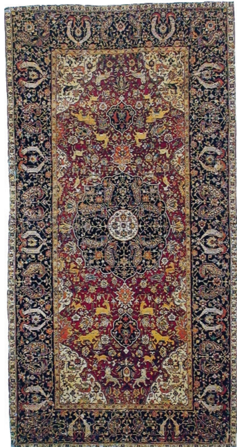
28. Περσικό χαλί, 16ος μ.Χ. αι.