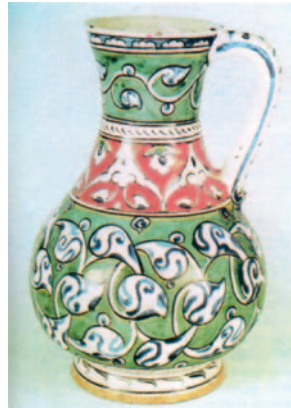
26. Τουρκική κανάτα, 16ος μ.Χ. αι.