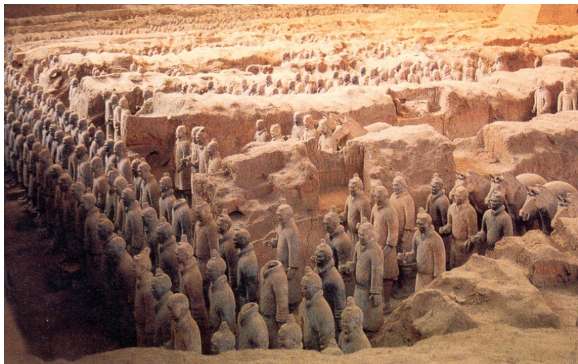
40. 41. «Ο Πήλινος Στρατός» του Πρώτου Αυτοκράτορα της Δυναστείας Τσιν, 209 π.Χ., αποτελείται από 6000 φύλακες, 8000 στρατιώτες και άλογα σε φυσικό μέγεθος, παραστάτες στον κοιμώμενο αυτοκράτορα.