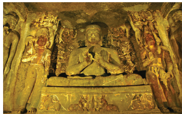
32.33. Ζωγραφικές και ανάγλυφες παραστάσεις στο ναό της Ατζάντα.